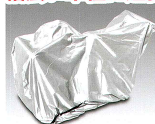
画像は装着イメージです。